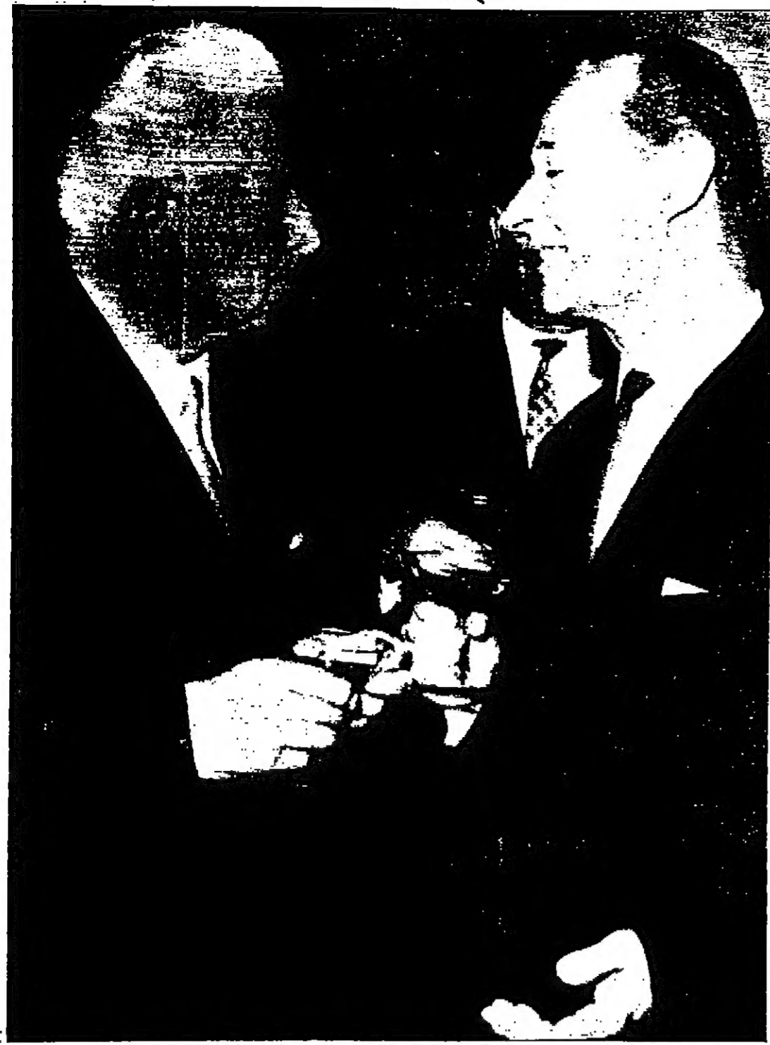
الجنرال لوفينغ سغوبورا « ٧٢ سنة - الى اليسار » يتحدث مع الجنرال الكندي دوتشيك السناتور الاول للحزب الشيوعي التشيكي بعد انتخاب الجنرال سغوبورا رئيسا لجمهورية تشيكوسلوفاكيا كان الرئيس السابق انطونين نوفوتني المستقيل

تأسست عام ١٩٢٧ يسر مدرسة فن قيادة السيارات ان تعلن عن افتتاح مكتبها الجديد لتعليم قيادة السيارات وصيانتها بإشراف المحرب التقدير (غزت عمره) شعلاها بالاخلاص في سبيل تعليم الراغبين في قيادة السيارات بالسرعة وقت وبأقل التكاليف والتجربة بجانبنا ملاحظة : عندنا قسم خاص للانسات والسيدات (تلفون ٢٥٤٢٢) عمان - شارع الشابسوغ - مكتب سفريات التاج